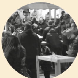
Funifira 11 i 12 de novembre