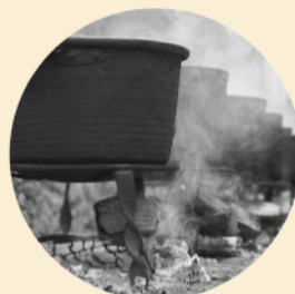
Diada de Santa Llúcia 13 de desembre