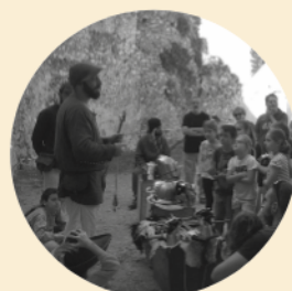
Jornades Europees de Patrimoni 6 a 8 de setembre