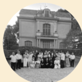
Jornades del Modernisme 10 i 11 de juny