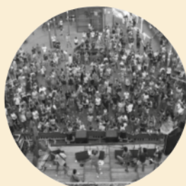
Festa Major 18 a 22 d'agost