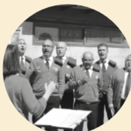
Caramelles Pasqua Florida